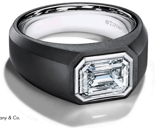
Tiffany & Co.